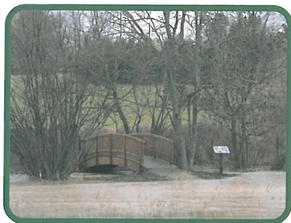
C'est bien Vienne mais c'est pas le Danube