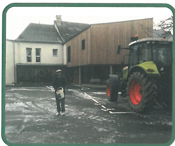
Salage au foyer Bois Soleil