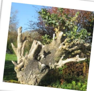
Très vieux buis (Bonsaïs extérieurs)