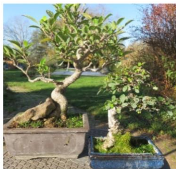
Ficus et Orme de Chine (Bonsaïs extérieurs)