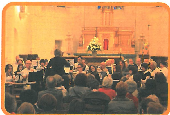
Concert en l'église de Saint-Cyr-sur-Loire le 31 mai 2013

Elle se dénomme : Ensemble Musical Escotais, Dême et Choisille (EMEDC)