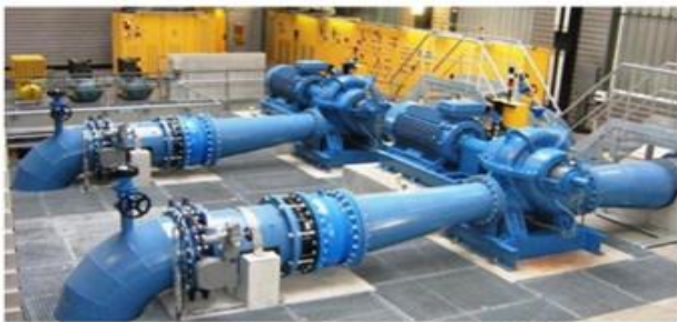
Station de pompage à Marray

Créé en 1963, le SIAEP de Marray-La Ferrière regroupe aujourd'hui six communes : Marray, La Ferrière, Les Hermites, Louestault, Chemillé-sur-Dême (sauf le bourg), et Épeigné-sur-Dême. Sa mission : capter, traiter et distribuer une eau potable de qualité à l'ensemble des habitants du territoire. En 2024, le syndicat dessert un peu plus de 2 200 habitants, soit 1 120 abonnés au réseau consommant au total environ 130 000 m 3 /an. Le syndicat est propriétaire des installations (2 stations de pompage, 200 km de réseau, 3 surpresseurs ...). Le service est exploité jusqu'en 2027, en délégation de service public par la société STGS. Une nouvelle procédure de mise en concurrence sera lancée en 2026.